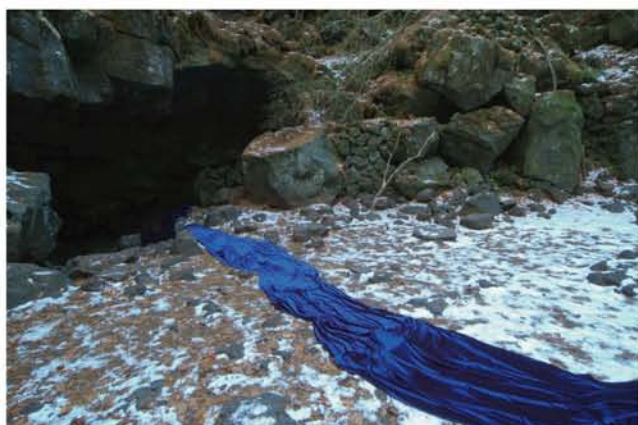
鷺山 啓輔 『B.V -the first season-』2005