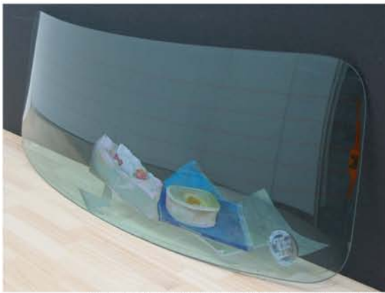
鈴木 恒成 『Still Life / Still Drive.#0』 2006