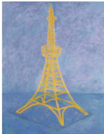
小林 丈人 『残されたイメージ-3』2006