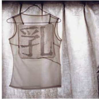
黒沼 真由実 『乳』 2005