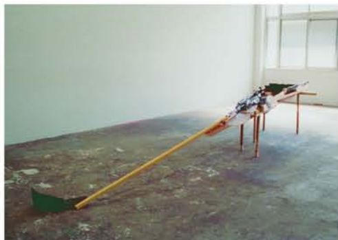
井出 賢嗣 『夜の草むらにたつ』2006