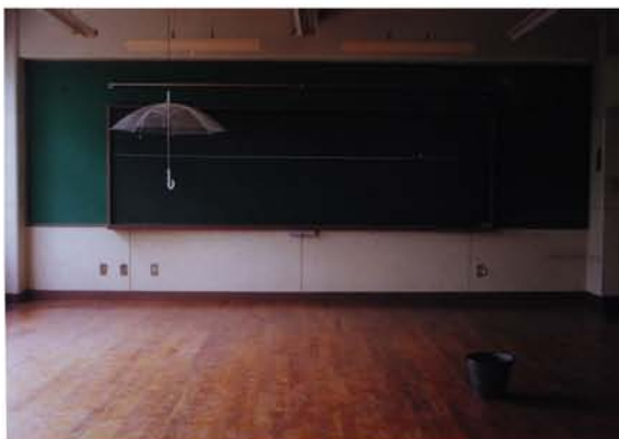
矢内 里 『無題』 2004