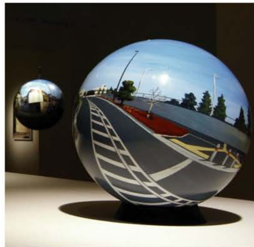
鮫島 大輔 『FLAT BALL』2005