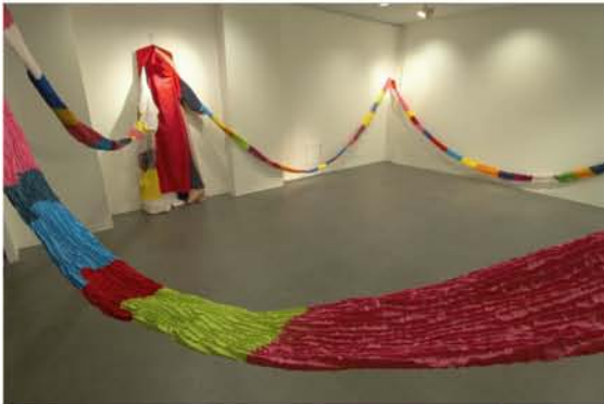
成田 久 『○』 2005