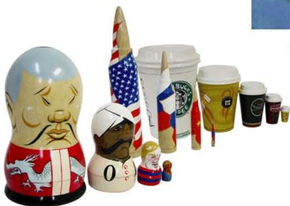
HRH 『MATRESHIKA (マトリョーシカ)』2006