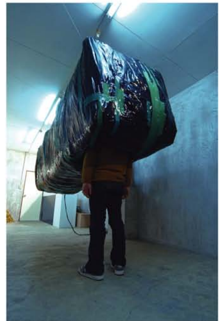
和田 昌宏 『Untitled(fly at Mach)』 2006