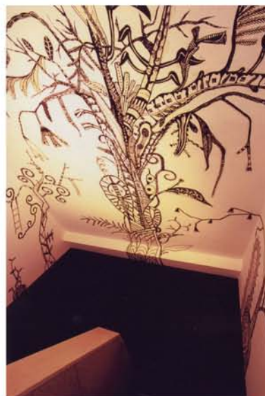
浅井 裕介 『Masking Plant in yamahusa』 2006