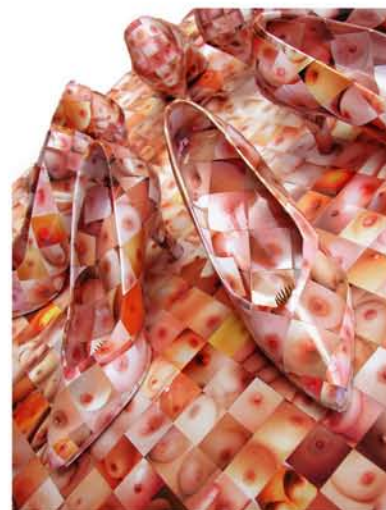
市川 健治 『活け花 2005』2005