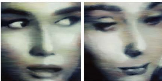
海老原 靖 『Sabrina』 2006